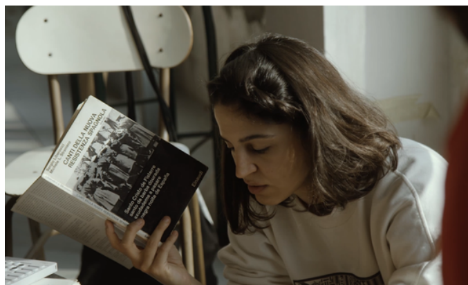
LA MARSELLESA DE LOS BORRACHOS